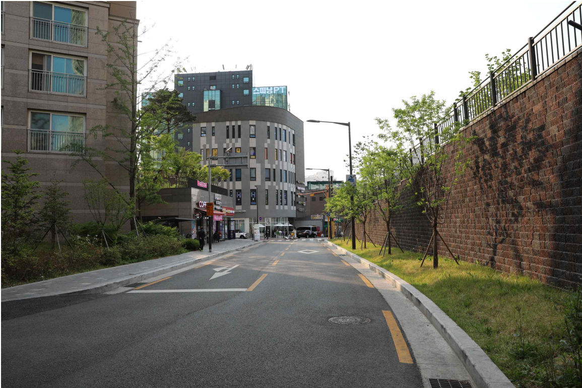
2022. 5. 20. 달맞이길에 자리한 도로의 한 모습을 촬영해 본다. 주변은 상가와 화단으로 되어 있고 이 길이 중심 도로의 한 부분이 되어 있다.