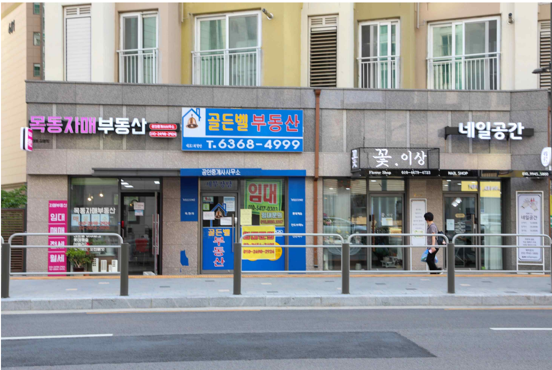
2022.5.20. 아파트와 공존하는 주상복합 상가를 촬영해 보았다. 단독주택 앞에 있던 그 시절 상가는 없어졌다.